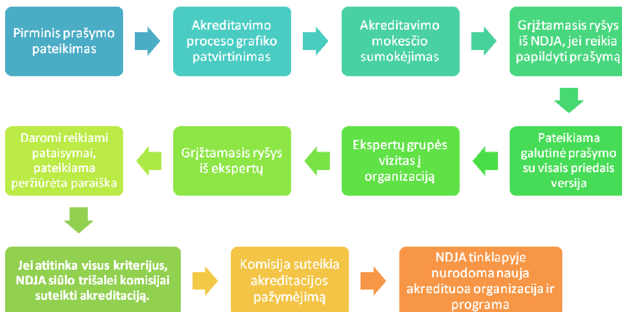
Schema Nr. 1 Organizacijų akreditavimo mechanizmo eiga

Organizacijos bei konsultantai siekiantys akredituoti savo programas ir paslaugas, turi dalyvauti akreditavimo procese, šio dokumento numatyta tvarka. Jaunimo darbuotojai, baigę akredituotas kvalifikacijos programas, kurios turi integruotą kompetencijų ir patirties vertinimo procedūrą, jau nebeturės pereiti atskiro kompetencijų vertinimo proceso. Sėkmingas visų akredituotų organizacijų teikiamų kvalifikacijos kėlimo modulių baigimas reiškia, kad sertifikatas turi būti išduotas tam asmeniui. Kaip ir aprašyta sertifikavimo metodikoje, asmenys gali rinktis ir neakredituotas mokymų programas, tačiau už jų turinį ir kokybę NDJA neatsako ir todėl asmenys, baigę tokias programas, turės pereiti kompetencijų ir patirties vertinimo sistemą.