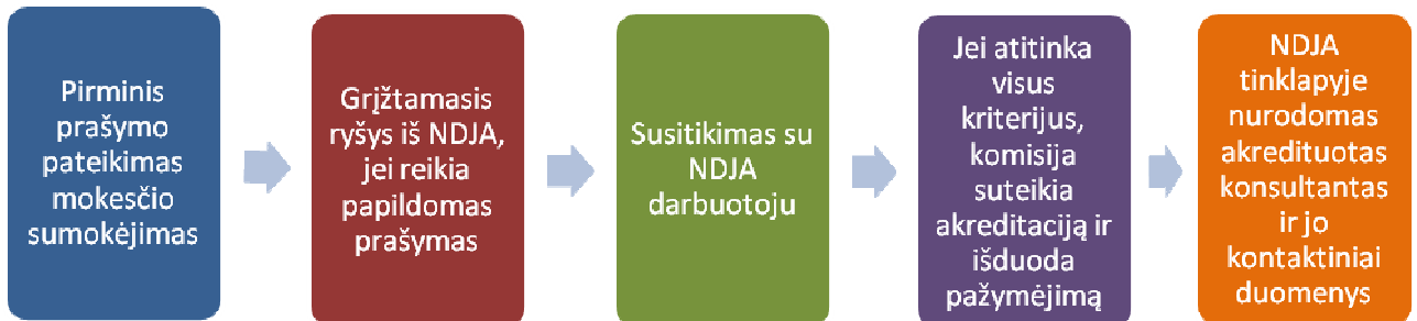
Schema Nr. 4 Konsultantų akreditavimo proceso eiga